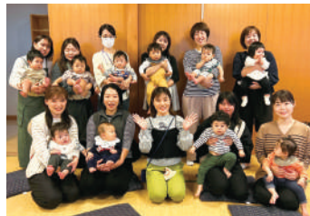
▲KIDSZOU（キッズぞう） 学んで交流する0歳～1歳児親子向けイベント