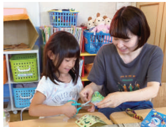
▲もうひとつの大きな家族 世代間交流のできる居場所づくり

提出時に事業内容の確認を行います。事前にご連絡の上、内容説明のできる方がお越し下さい。