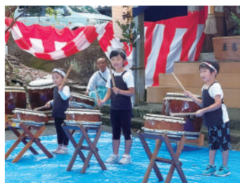
▲仁ノ八幡宮保存会 仁ノ八幡宮の祭りを盛り上げ町を元気にしよう！