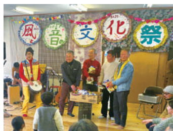
▲ふらっと浦戸 うらど「風と音文化祭」