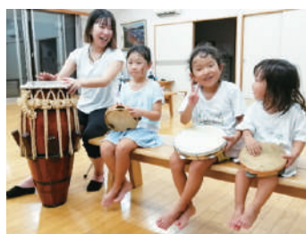
▲CICABK（高知アフロブラジル文化コミュニティ） 「カポエイラ」でづくり、まちづくり