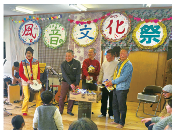
▲ふらっと浦戸 うらど「風と音文化祭」