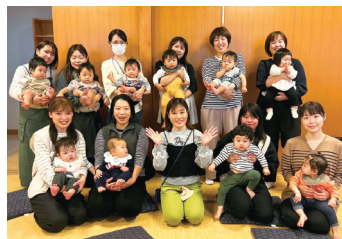
▲KIDSZOU（キッズぞう） 学んで交流する0歳～1歳児親子向けイベント