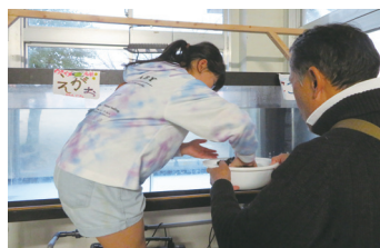
▲カレッタ 児童と保護者、学校、地域住民による アカウミガメの飼育