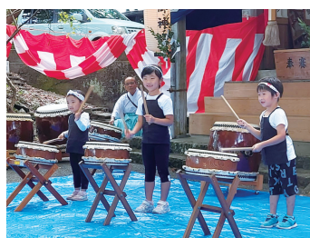
▲仁ノ八幡宮保存会 仁ノ八幡宮の祭りを盛り上げ町を元気にしよう！