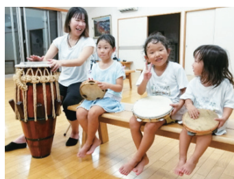
▲CICABK（高知アフロブラジル文化コミュニティ） 「カポエイラ」でぶづくり、まちづくり