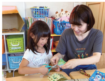
▲もうひとつの大きな家族 世代間交流のできる居場所づくり

提出時に事業内容の確認を行います。事前にご連絡の上、内容説明のできる方がお越し下さい。