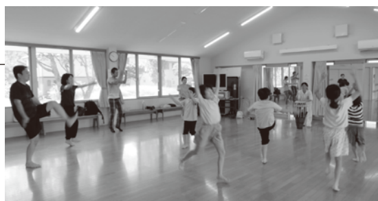
▲大人も子どもも一緒に全身で動きます

多様性を尊重し、全員参加型で取り組むのがカポエイラです。年齢、性別、身体能力を問わず、誰でも参加することができます。楽器を演奏したり歌を歌ったりするだけの参加や見学のみも大歓迎です。