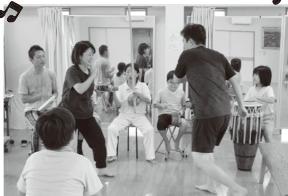
▲リズムに合わせて息をあわせて疑似格闘

ダンス、格闘、音楽、芸術など様々な要素が盛り込まれたブラジルの大衆文化です。円陣を組み、中に入った二人が、生演奏の音楽に合わせて疑似格闘を行います。ユネスコの世界無形文化遺産にも登録されています。