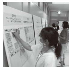
▲高知市まちづくりファンド名物ふせん貼り