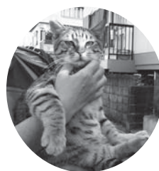
▲南竹島町手術済みネコ