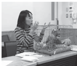
▲下知地区防災訓練

卒業するのは寂しいですが、また新しい形で再挑戦したいと思います。有難うございました。