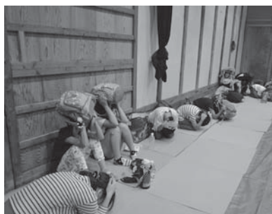
▲命を守る減災プログラム

全てが望む結果になるとは限りません。ですが、このサイクルを粘り強く続けることであなたや市民は変化し、高知がより元気に豊かになる未来が訪れるのだと信じています。