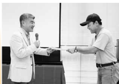
御畳瀬ひもの祭り実行委員会