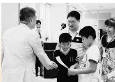
高知発達障害等親の会「KOSEI」

市民団体が継続して行うまちづくり活動を支援する「まちづくり一歩前へ」コースは、同一の事業内容に対して3回まで助成を受けることができます。「御畳瀬ひもの祭り実行委員会」と「高知発達障害等親の会『KOSEI』」は、2005～2007年度と連続助成を受け、今年、公益信託高知市まちづくりファンドを卒業しました。